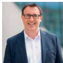
Sören Bartol , Bundestags- abgeordneter